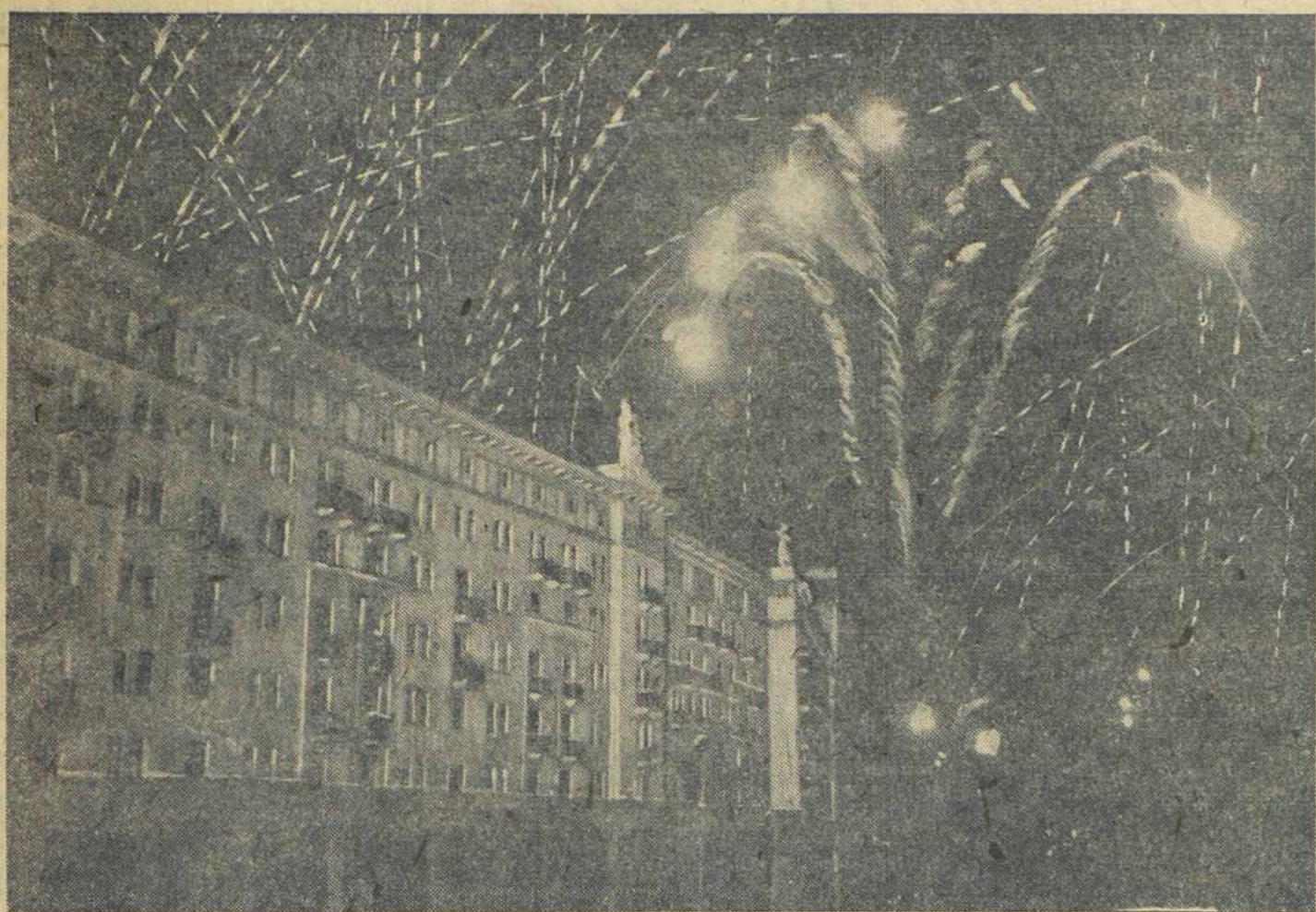
В небе Москвы 23 августа в 21 час, в момент салюта.